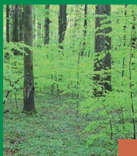
Soins et précautions