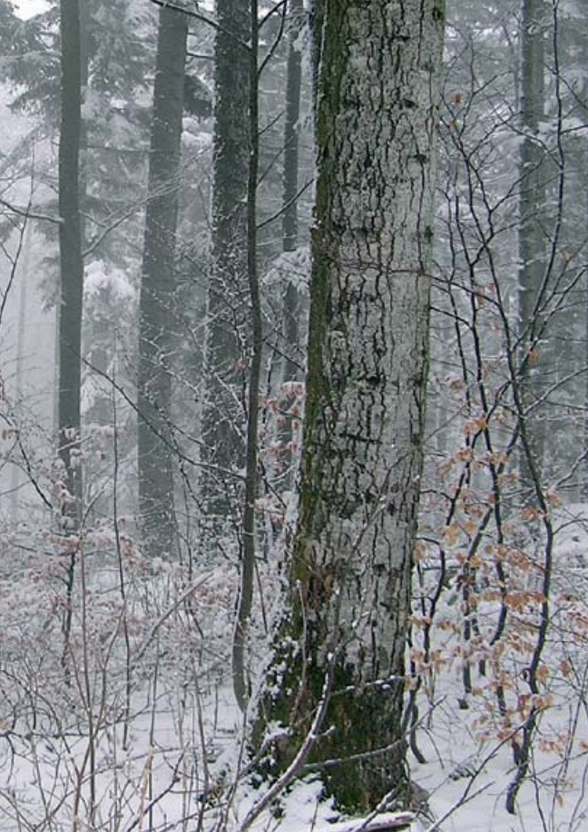
→ Hêtraie-sapinière (01)

La futaie irrégulière est parfaitement compatible avec une gestion cynégétique dynamique grâce à la présence continue dans l'espace et le temps de jeunes repousses et d'un couvert régulier alternant avec de petites trouées. La diversité des milieux, notamment le maintien permanent de zones touffues peu pénétrables et appréciées de nombreux gibiers, permet réellement de concilier une production de bois de qualité et un espace cynégétique intéressant.