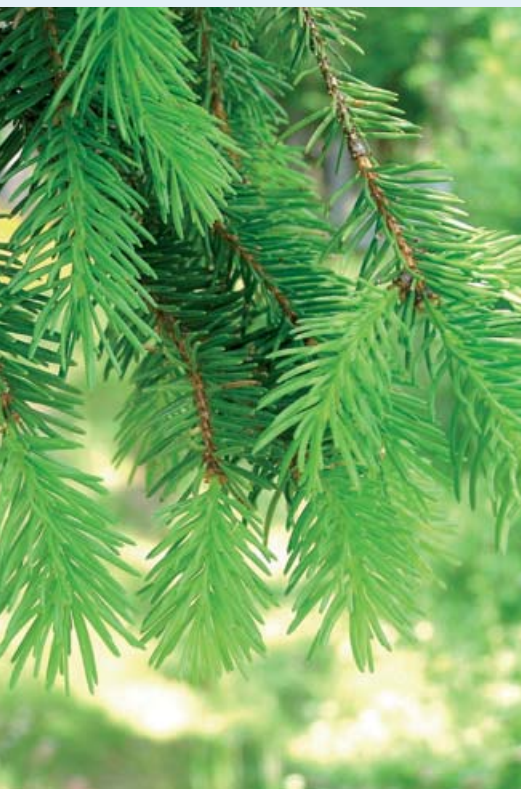
→ Pousses annuelles d'épicéa (73)

En futaie irrégulière, les coupes de bois sont limitées en volume mais rapprochées dans le temps. Ces coupes ont à la fois pour objectifs la récolte de bois mûrs, l'exploitation d'arbres malades,