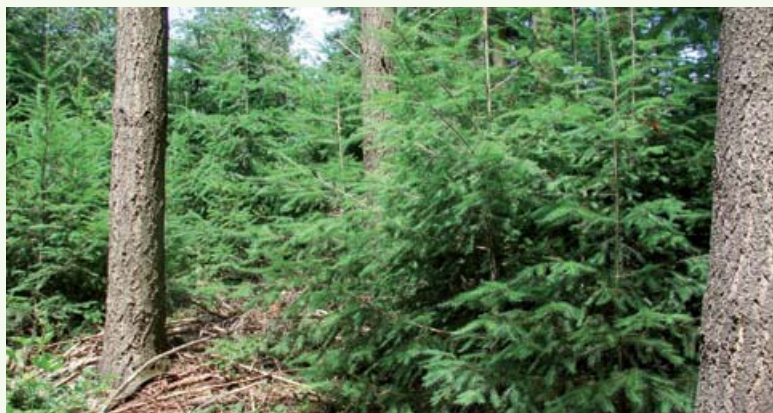
→ Régénération de douglas sous douglas (69)

Elle limite les risques économiques (chute des cours, mévente des bois) et phytosanitaires (maladies, ravageurs), en cas de mélange d'essences, en évitant « de mettre tous ses œufs dans le même panier ».